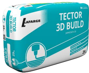
Fecha de fabricación y detalle del producto impreso en los laterales del saco