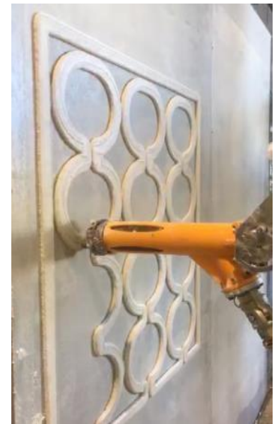
Elementos decorativos verticales en fachadas.