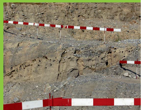
Figura 6 Barrera para la protección de colonias de avión zapador.