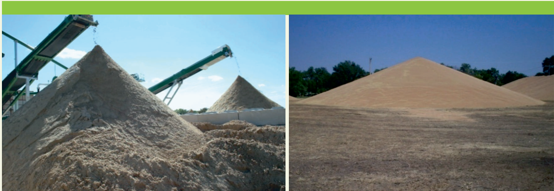
Figura 3 Acopios activos sin paredes verticales. Ambos acopios disuaden a los aviones zapadores de construir colonias en ellos.

La extracción con pendientes menores de 60° y la monitorización de zonas activas no ocupadas por el avión zapador se mantendrán hasta mediados de julio, momento en el que las aves ya no inician la puesta de huevos.