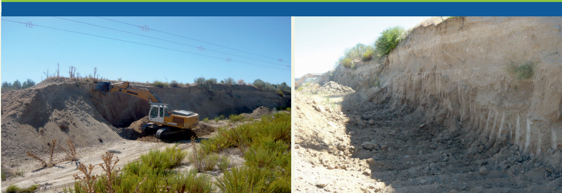
Figura 5 Izquierda: Retroexcavadora preparando un frente vertical para aviones zapadores en talud inactivo. Derecha: Resultado final.