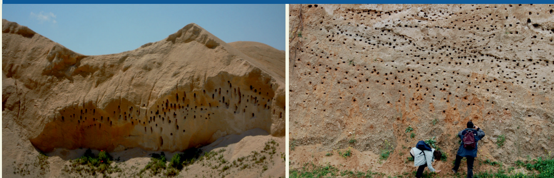
Figura 4 Colonias de avión zapador en acopio (izq.) y talud (dcha.) inactivos.