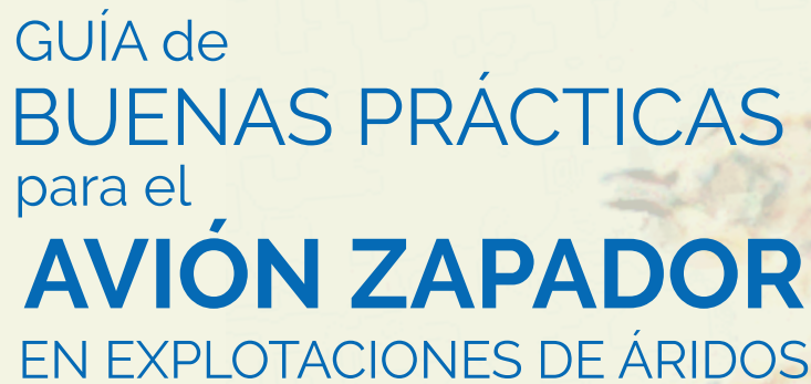
Imagen de portada: