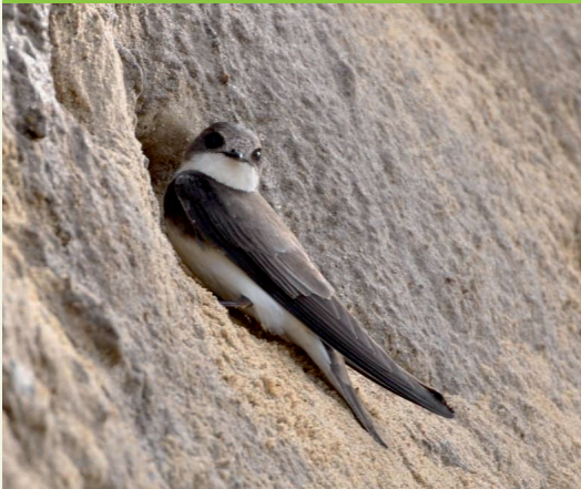
Figura 1 Avión zapador adulto)

El avión zapador ( Riparia riparia ) es un ave migratoria de interés de conservación en Europa y protegida en España. Se reconoce por su parte superior parda, parte inferior blanca, y una característica banda transversal parda en el pecho (Figura 1). Es una especie colonial, cuyos hábitats naturales de nidificación son los taludes de ríos, arroyos y lagos con bancos arenosos recientemente erosionados, y también a menudo nidifica en espacios mineros. En estos taludes excava madrigueras al final de las cuales se encuentran sus nidos. En las últimas décadas y en amplias zonas de su área de nidificación mundial, el avión zapador ha incrementado el uso de los espacios mineros como zonas de nidificación, donde concentra sus principales colonias de cría. Esto es una oportunidad para que el sector de áridos