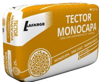
Fecha de fabricación y detalle del producto impreso en los laterales del saco